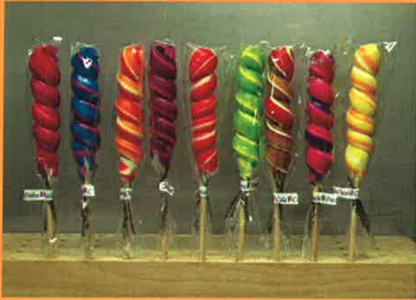
3683 H 21cm