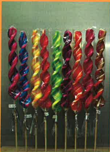
3694 H 41cm