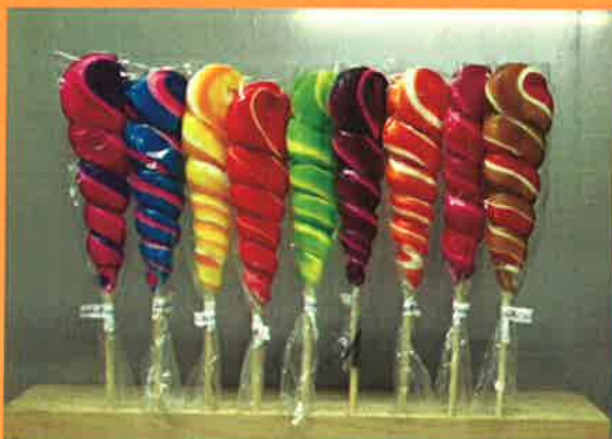
3690 H 31cm