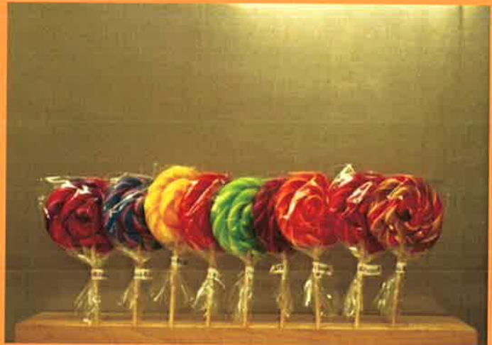
3686 H 16cm