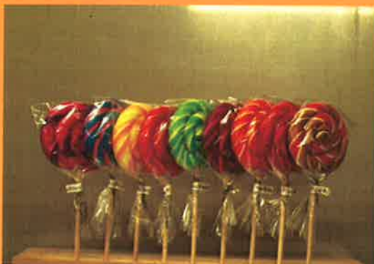
3687 H 21cm