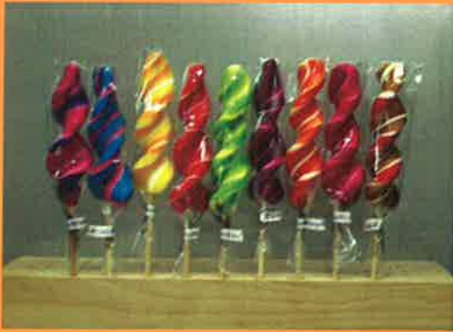
3692 H 21cm