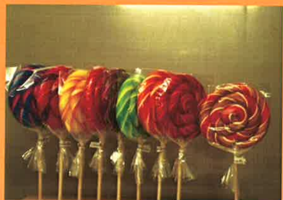
3688 H 25cm