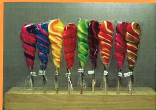
3689 H 21cm