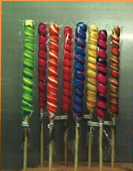
3683 H 41cm