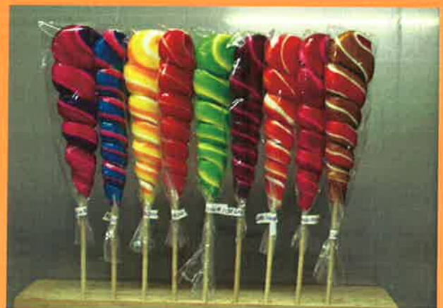
3691 H 41cm