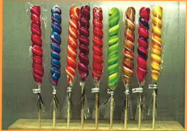
3684 H 31cm