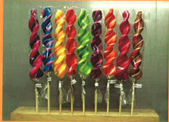
3693 H 31cm